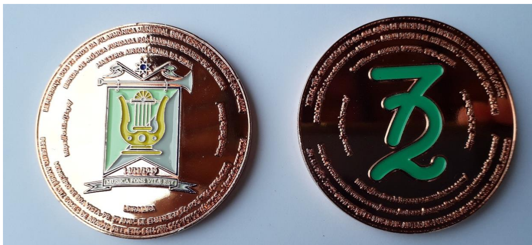
Foto: Medalla alusiva a la finalización del grado en Música (2021)

En 2022, se convirtió en colaborador del Instituto Histórico de Campina Grande-PB (IHCG), escribiendo artículos musicales para su publicación en el periódico impreso trimestral.