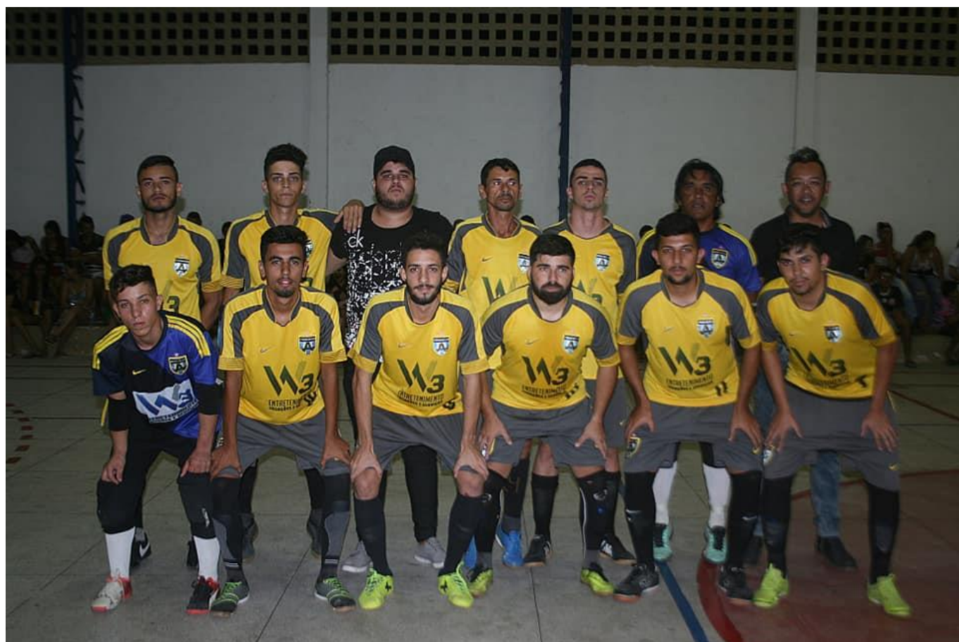
Formações de Futsal no Ginásio de Esporte “O Cabeção”