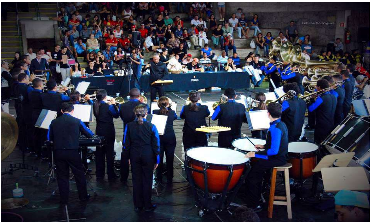
Concurso no Sesc Interlagos, 2014