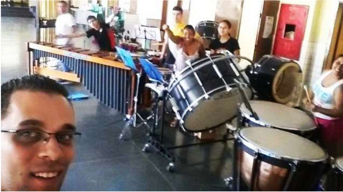
Grupo de percussão da escola João de Deus Cardoso de Mello – 2014