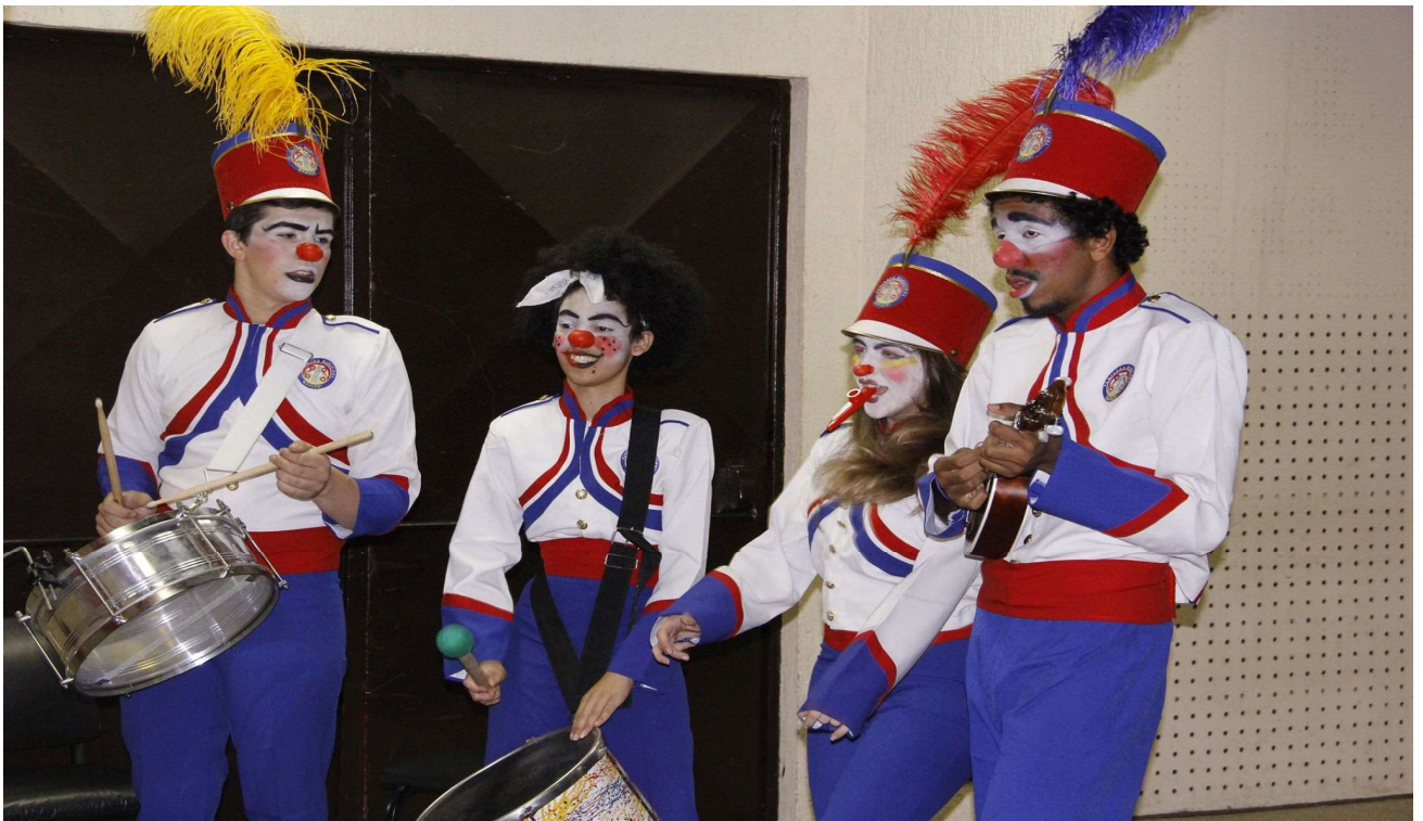
Apresentação alusiva ao dia do palhaço - 2014