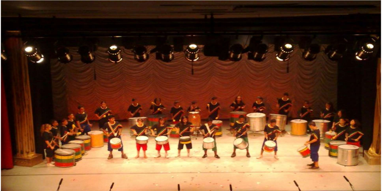
Batuqueri 2010 – apresentação Teatro de Barueri