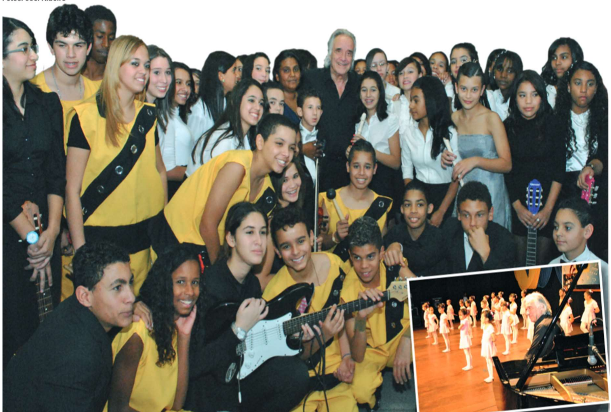
Apresentação para o maestro João Carlos Martins – 2010